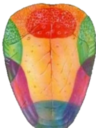
Рис.1. Вкусовые зоны языка

Задание: красным цветом раскрась ГОРЬКУЮ вкусовую зону языка. Зеленым цветом раскрась КИСЛУЮ вкусовую зону языка. Фиолетовым цветом раскрась СОЛЕНУЮ вкусовую зону языка, а голубым – СЛАДКУЮ.